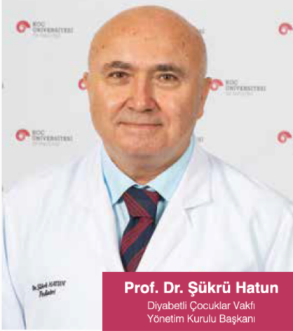
Prof. Dr. Şükrü Hatun Diyabetli Çocuklar Vakfı Yönetim Kurulu Başkanı

Tip 1 diyabet tedavisi, mümkün olan en fizyolojik yani pankreasa en benzer şekilde insülin replasmanı, karbonhidrat sayımına dayalı beslenme planlanması, düzenli (sürekli) glukoz izlemi, diyabet eğitimi ve diyabet bakım bilinci (motivasyonu) ve çocuk diyabet ünitelerinde düzenli izlem ile